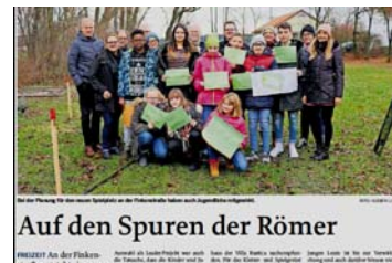
Auf den Spuren der Römer

Kosten: 117.113 €, Fördersatz: 50% (Nettokosten) Im Rahmen eines gemeinsamen Pressetermins am 12.12.2018 wurde das Projekt gemeinsam mit der Angrüner-Mittelschule gestartet. Mehrere Schulklassen unterstützen die Aktion und werden sich die nächsten Monate im Rahmen von Kleinprojekten (Erstellung von Informationstafeln, Logos, soziale Medien) im Unterricht beschäftigen.